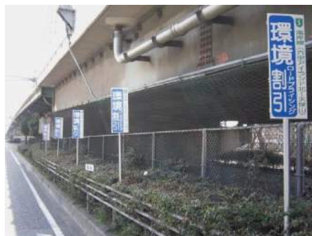
中央分離帯への設置