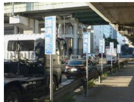
中央分離帯への設置