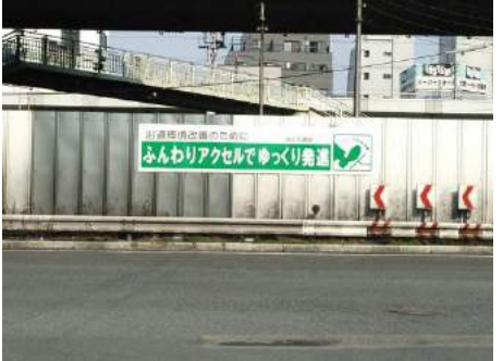
フェンスへの設置