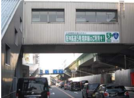
横断歩道橋への設置