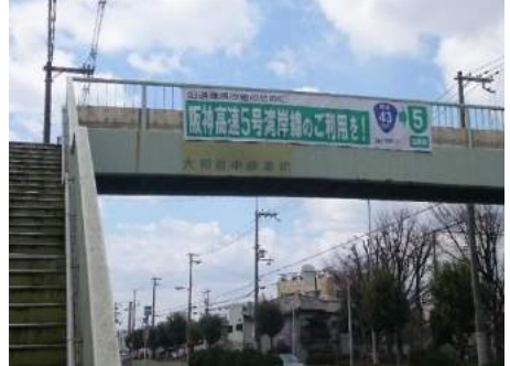
横断歩道橋への設置 (大阪市管理歩道橋)