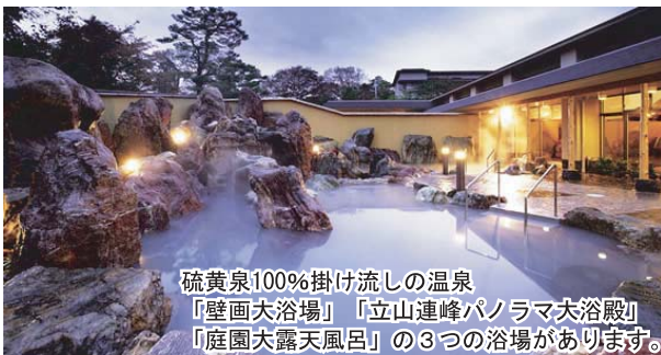
硫黄泉100%掛け流しの温泉 『壁面大浴場』『立山連峰パノラマ大浴殿』 『庭園大露天風呂』の3つの浴場があります。