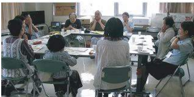
よく使う呼吸筋の位置ををみんなで確認

たくさんのエネルギーが必要です。息切れにより食欲が落ちる→エネルギーを摂りにくい→体力や筋力が落ちる→息切れが強くなる…という悪循環に陥りがち。十分な栄養やエネルギーが必要なのに不足しやすいため、やせ型の人が多いです。