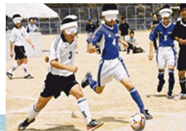
ブラインドサッカー