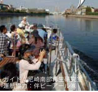
ガイド：尼崎南部再生研究室 運航協力：伴ピーアール㈱

運河沿いに立ち並ぶ工場群を眺めるガイドクルーズ。1時間ごとに運航。9/16から事前予約を開始します。受付は先着順。対象は3歳以上。乗船料2000円(小学生以下は1000円)。☎06-6438-1852 受付：尼崎南部再生研究室 10:00/11:00/12:00/13:00 14:00/15:00/16:00の計7便 定員各20名