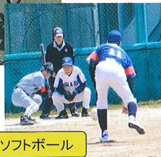
グラウンドソフトボール