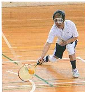
ブラインドテニス