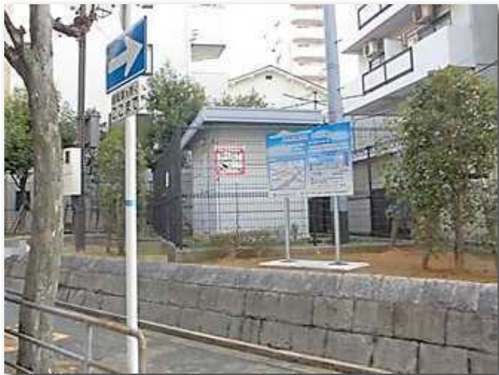
■大和田局（阪神高速道路管理） （令和4年1月設置完了）