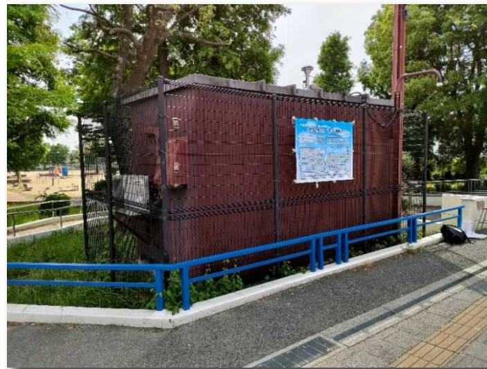
■新佃公園前局（大阪国道事務所管理） （令和4年5月設置完了）