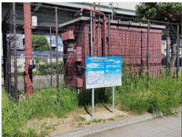
■大和田西交差点局（大阪国道事務所管理） （令和4年8月設置完了）