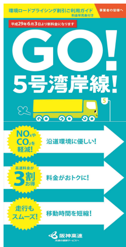
リーフレット (現 行)