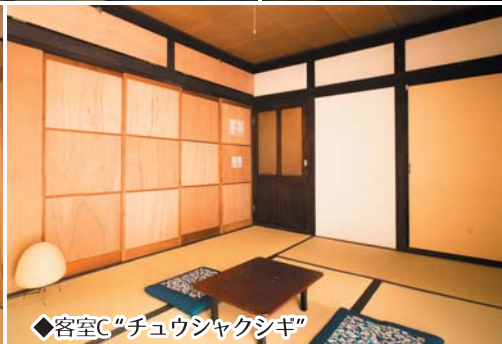
◆客室C“チュウシャクシギ”