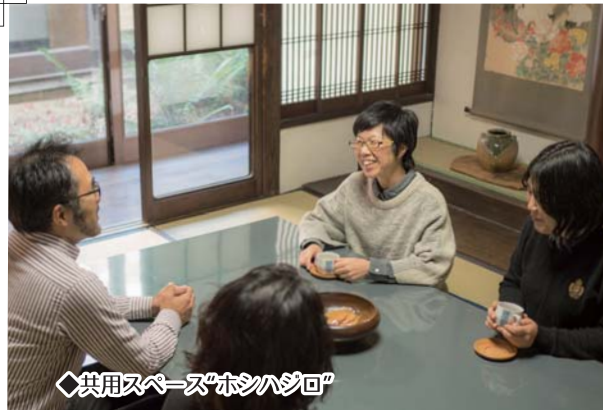
◆共用スペース“ホシハシロ”