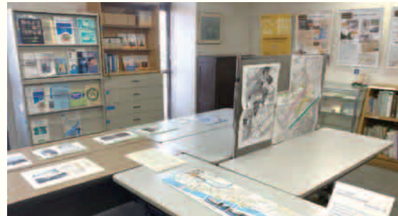
企画展「昔の西淀川区の川と水辺の風景～大野川と中島大水道～」みてアート2023

大野川や大野川と接続していた中島大水道、そしてそれらが埋め立てられたことでできた大野川緑陰道路沿いの風景を中心に、西淀川区一円の「水辺の風景」に関する資料を、写真資料を中心に展示しました。来館者の中には、展示された写真が撮影された頃の様子を教えてくださいました人もいました。