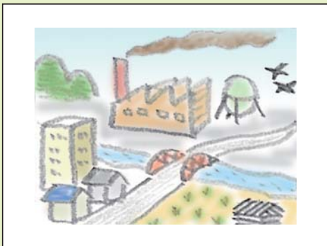
地域の大气汚染公害が わかる写真