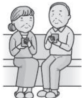
健康寿命を伸ばす