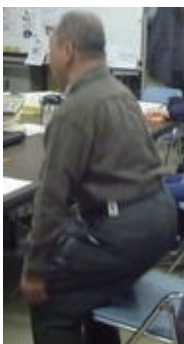
30秒椅子立ち上がりテスト