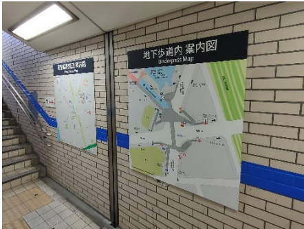
地下道案内サイン（階段踊り場部）